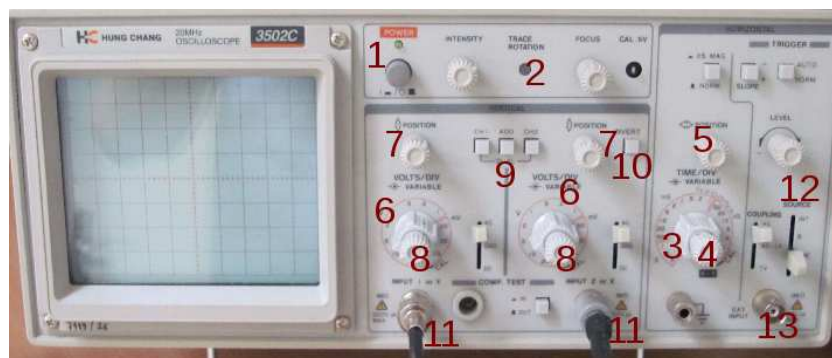
Obrázek B.2: Osciloskop Hung chang 3502C. Čísla označují umístění ovládacích prvků zmíněných v textu. Knoflíky 4 a 8 jsou umístěny ve středu přepínačů 3 a 6.

Většina osciloskopů dále obsahuje přepínač, kterým můžeme odstranit stejnosměrnou složku, pokud pro nás není zajímavá. Tento přepínač bývá označen DC/AC/GROUND. V poloze AC (alternating current – střídavý proud) je ke vstupu připojen kondenzátor, který odfiltruje stejnosměrnou složku. V poloze DC (direct current – stejnosměrný proud) je vstup přímo zobrazován včetně stejnosměrné složky. Pro odečítání absolutní hodnoty stejnosměrné složky je třeba porovnat s nulovou hladinou, pro tento účel můžeme použít polohu GROUND, kdy je vstup osciloskopu uzemněn.