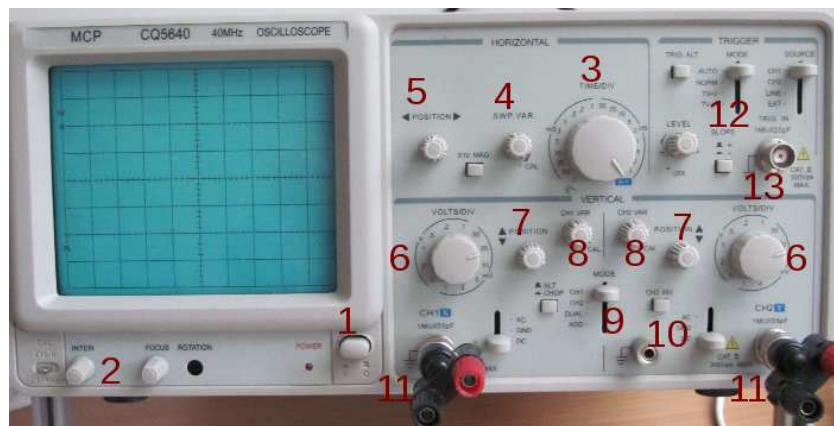
Obrázek B.1: Osciloskop MCP CQ5640. Čísla označují umístění ovládacích prvků zmíněných v textu.

Dva typické analogové dvoukanálové osciloskopy jsou zobrazeny na obrázcích B.1 a B.2. Tyto